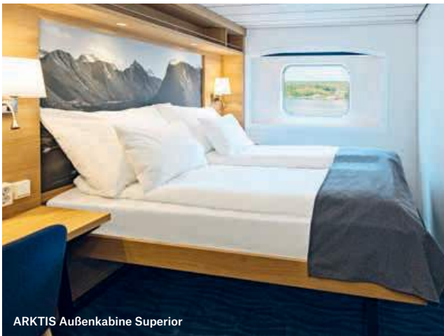
ARKTIS Außenkabine Superior

KABINEN: 221 UND 2 SUITEN BRZ: 11.204 BAUJAHR: 1993 LÄNGE: 121,8 METER MODERNISIERUNG: 2016 UND 2022 BREITE: 19,2 METER WERFT: VOLKSWERFT, DEUTSCHLAND GESCHWINDIGKEIT: 15 KNOTEN